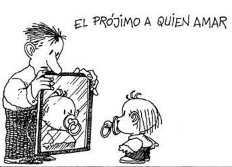
EL PRÓJIMO A QUIEN AMAR