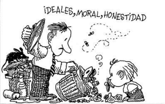
IDEALES, MORAL, HONESTIDAD